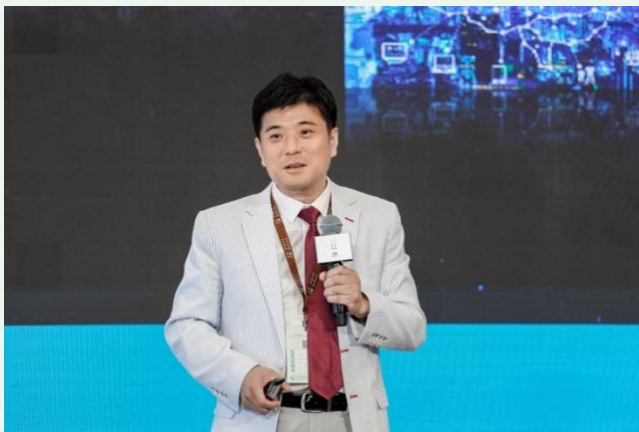
8. 微醫集團總裁兼 CTO、原 IBM 全球高級副總裁王陽博士