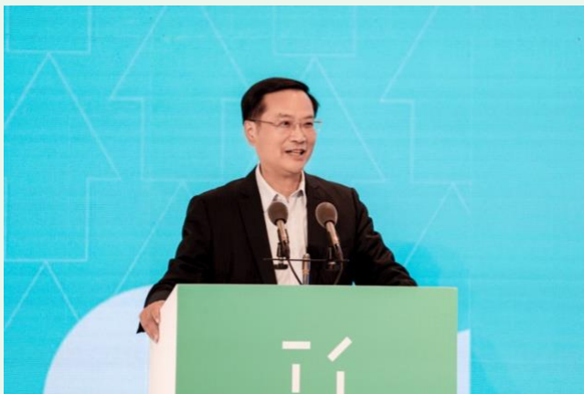
11. 香港科技大學（廣州）教授，清華大學教授，清華大學 PPP 研究中心主任，中國光大環境（集團）有限公司前總裁、董事會主席王天義教授