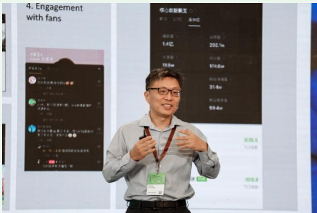
5. 清華大學雙聘教授，美國國家工程院外籍院士，英國皇家工程院外籍院士沈向洋博士