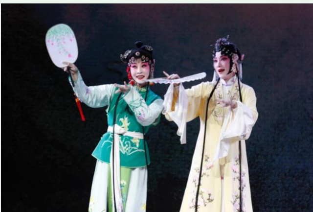
14. 江蘇省蘇州崑劇院的傑出演員們演繹經典劇目《牡丹亭》