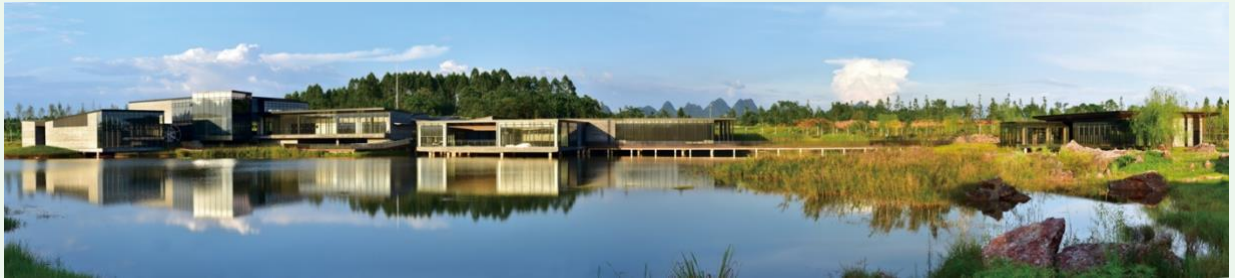
1. 溢達集團可持續發展園林：十如

「十如對話」宣導深入探討環境和經濟共同繁榮的挑戰與機遇，十如則呈現了紡織服裝行業開創性的可持續發展模式。詳情請流覽 2022 十如對話 。