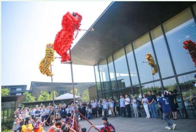
10. 十如開園儀式：醒獅表演