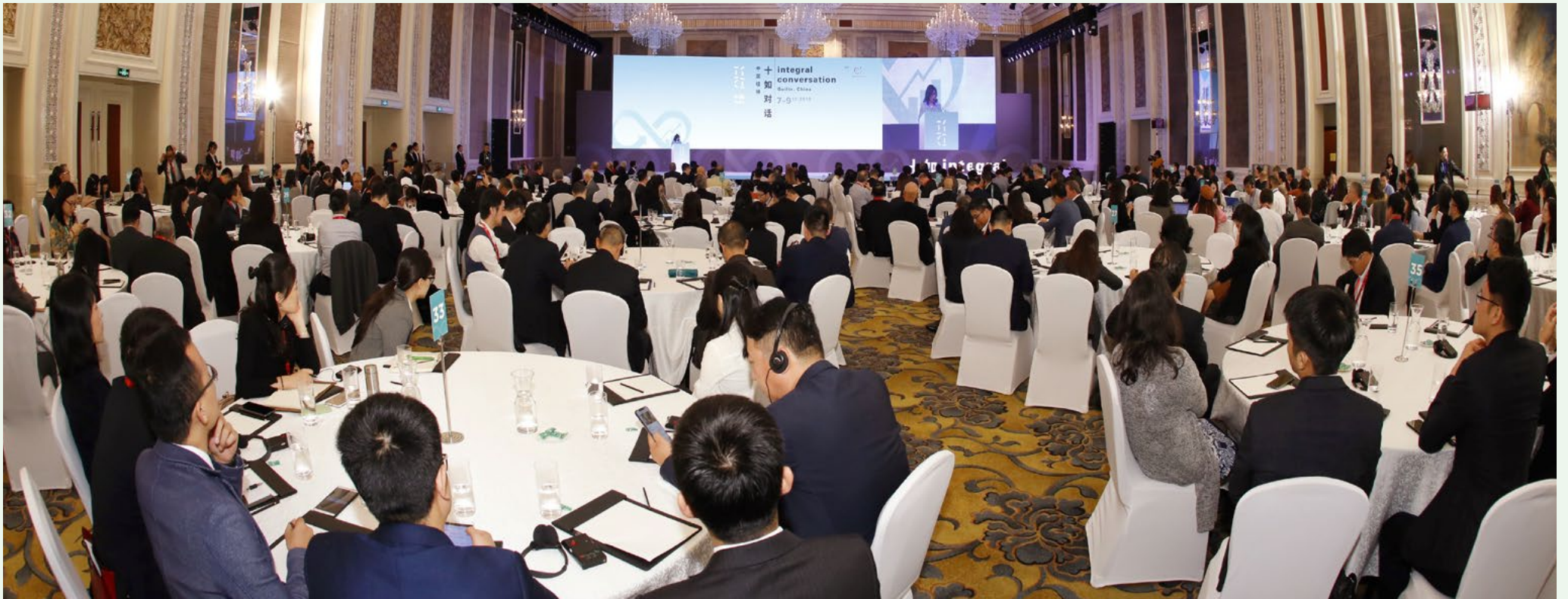
由溢達集團舉辦的第六屆「十如對話」已於11月7－9日於桂林圓滿舉行。