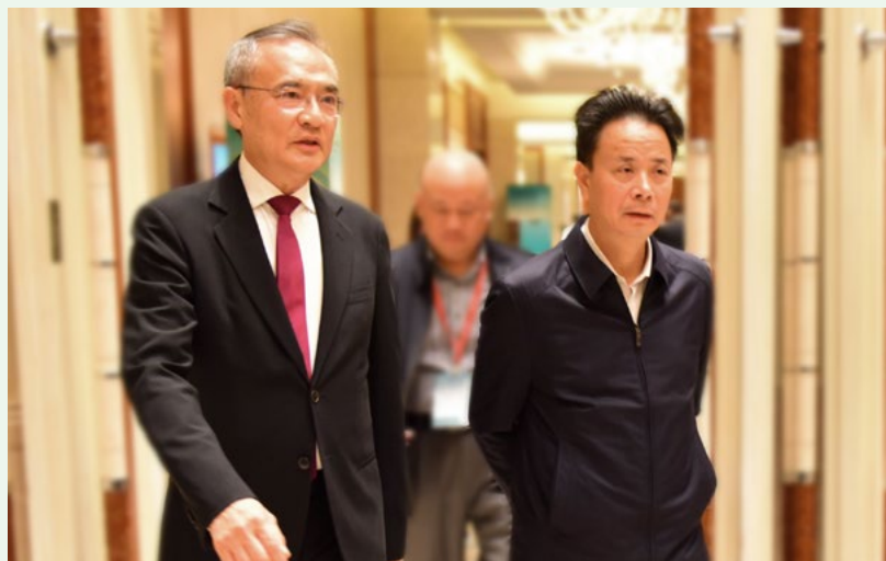
左起：溢達集團副董事長兼首席執行官車克燾與桂林市常務副市長張曉武

溢達集團品牌及分銷董事總經理潘楚穎表示，適逢「十如」在今年正式投產及運作，因此本年度會議別具意義。桂林市常務副市長張曉武為席上嘉賓之一。