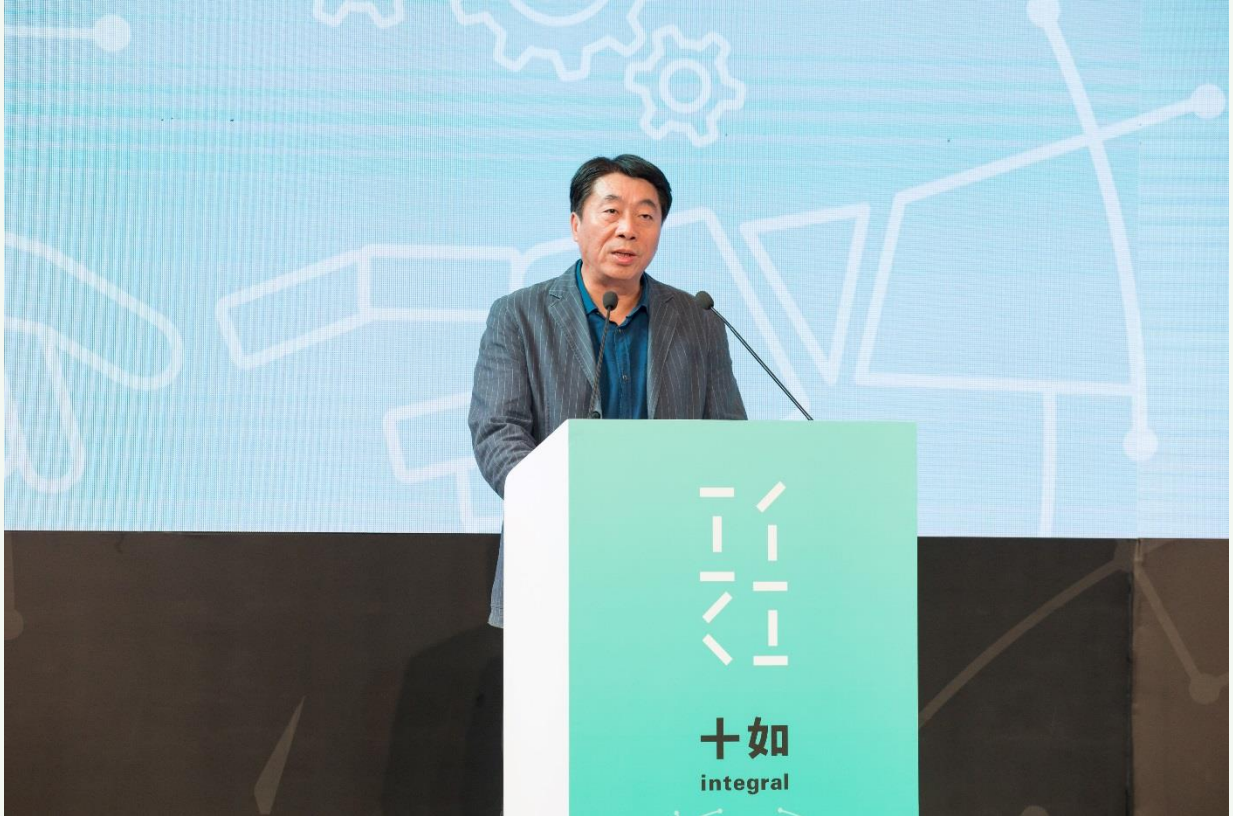
桂林市人大常委会副主任徐锋表示很欣喜看到十如对话成为凝聚智慧力量的平台。