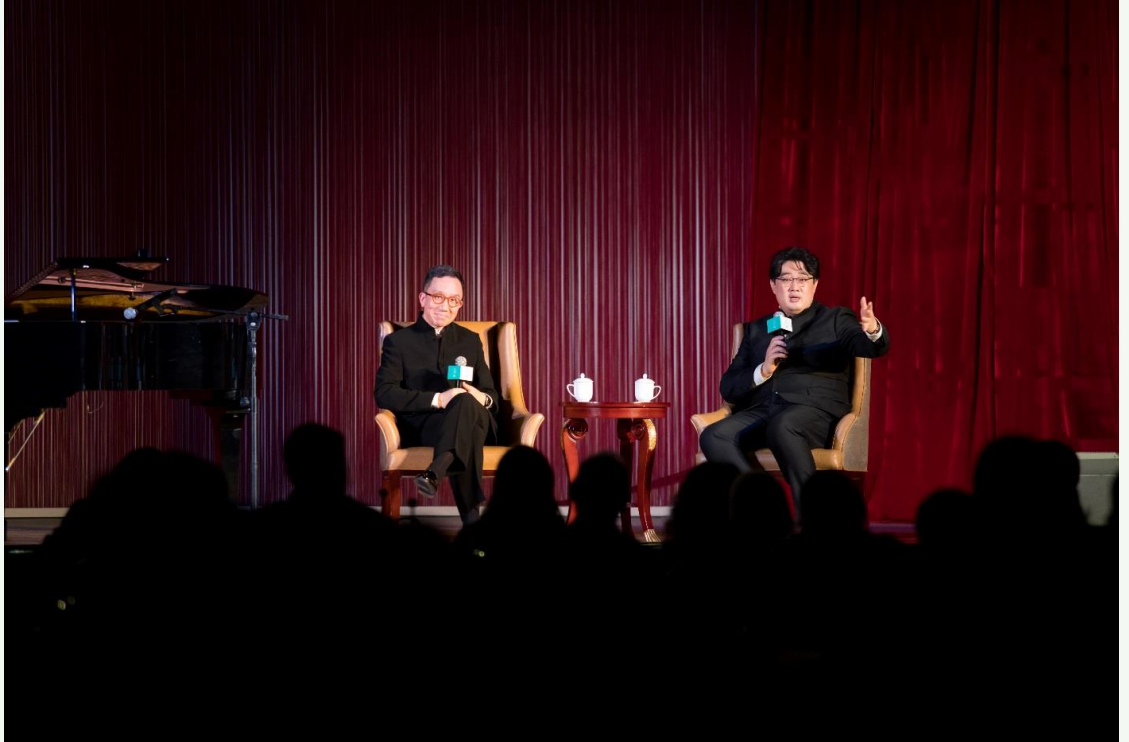
中国著名低男中音歌唱家沈洋在香港大学李嘉诚医学院院长梁卓伟的钢琴伴奏下，为台下嘉宾献唱，并就古典音乐及文化展开对话。