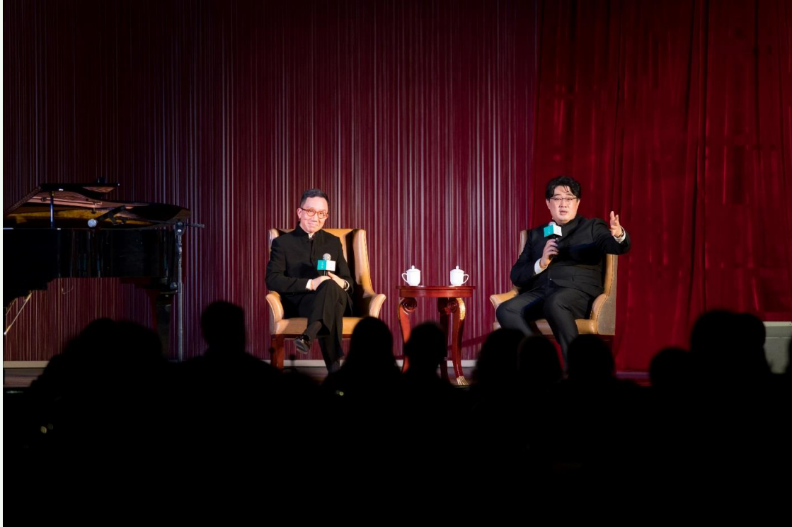
中國著名低男中音歌唱家沈洋在香港大學李嘉誠醫學院院長梁卓偉的鋼琴伴奏下，為台下嘉賓獻唱，並就古典音樂及文化展開對話。