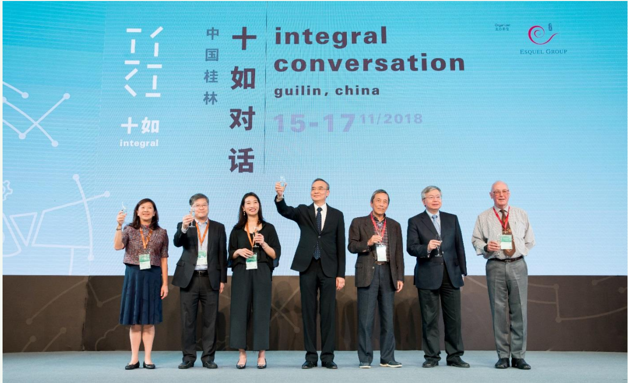
溢達集團代表向嘉賓舉杯祝酒，為 2018 十如對話揭開序幕。