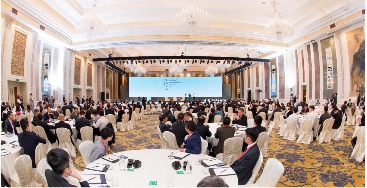
由溢達集團主辦、薈聚企業領袖、學者及主要的持分者的 2018 十如對話圓滿舉行。