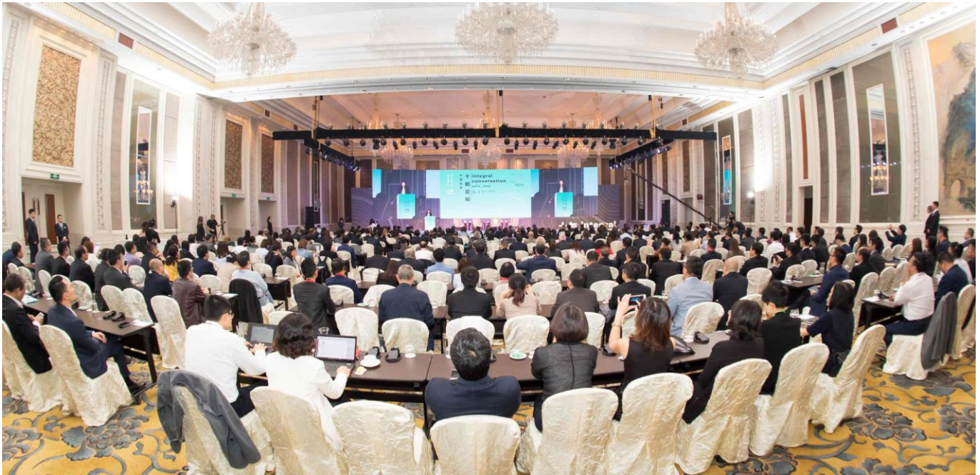
2017 年度十如論壇圓滿舉行。