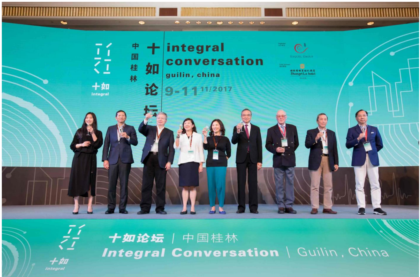
2017 十如論壇正式開幕。