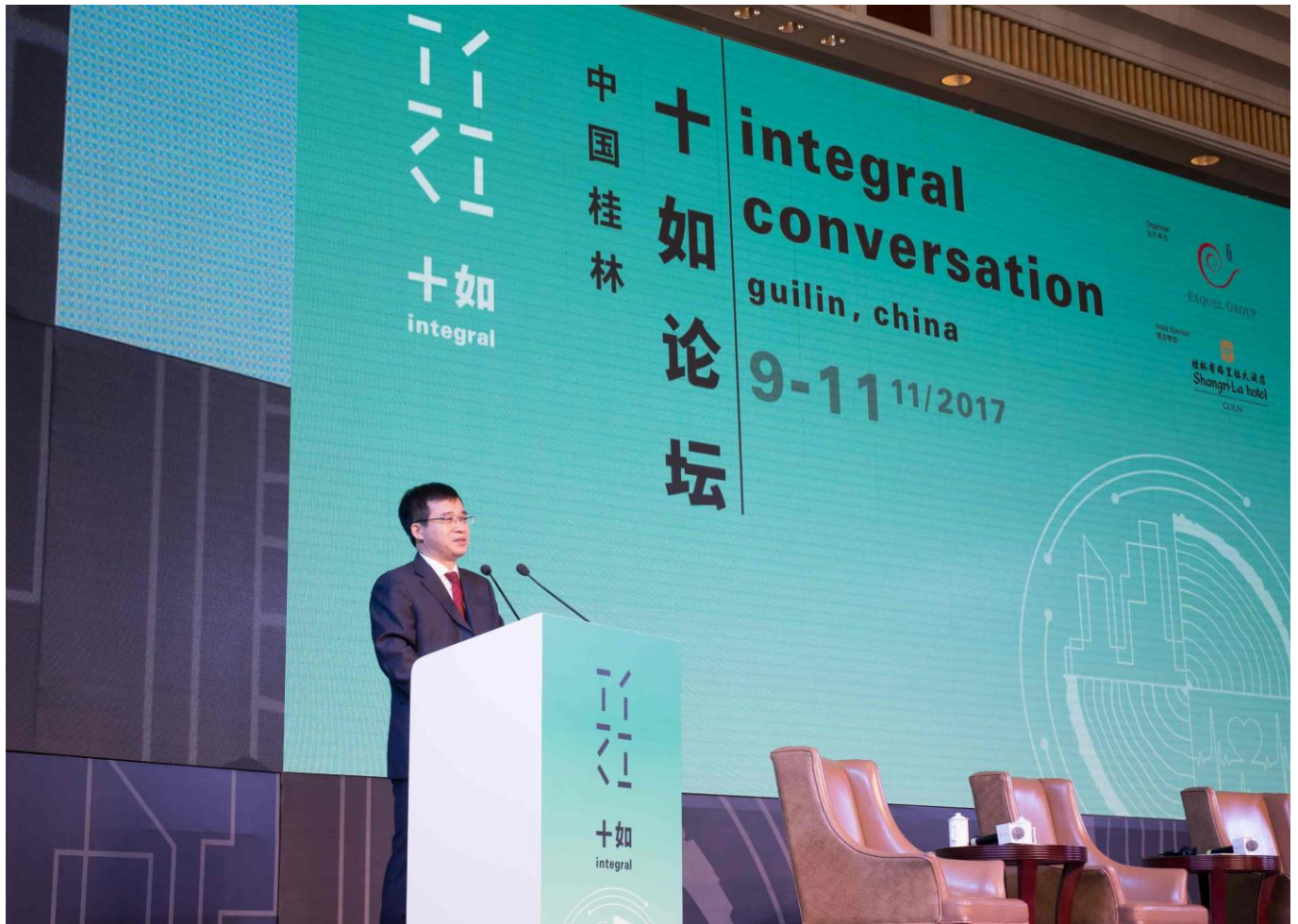
桂林市委副书记樊新鸿致欢迎辞。