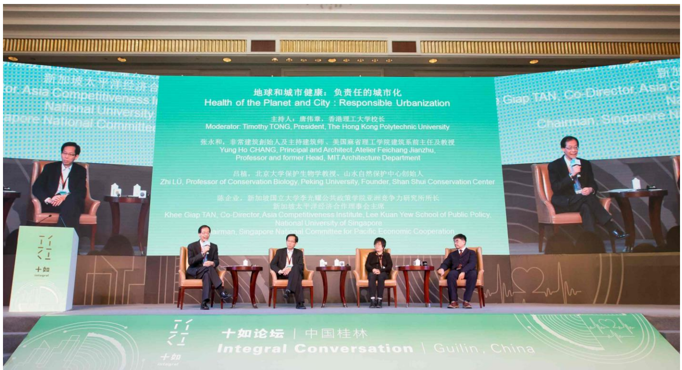
第一場研討會議「地球和城市健康：負責任的城市化」。左起：香港理工大學校長唐偉章；新加坡國立大學李光耀公共政策學院亞洲競爭力研究所所長、新加坡太平洋經濟合作理事會主席陳企業；北京大學保護生物學教授、山水自然保護中心創始人呂植；非常建築創始人及主持建築師、美國麻省理工學院建築系前主任及教授張永和。