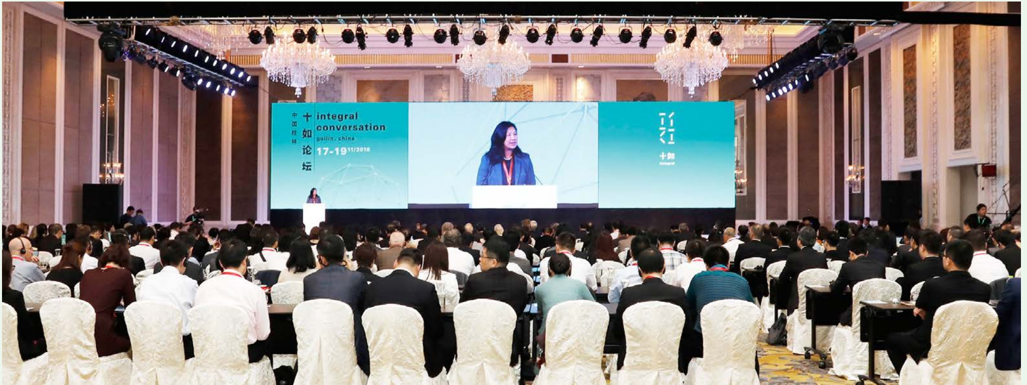
由溢達集團舉辦的第三屆「十如論壇」於11月17 - 19日於桂林圓滿舉行並獲數百位貴賓及媒體支持出席。